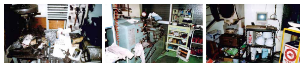
枚岡合金工具のビフォー・アフター

枚岡合金工具は、3S 活動歴 20 年以上。これまでに 2,000 社、16,000 名が工場見学に来社されています。3S のノウハウと、継続することの難しさをよく知る現役の製造業が、あなたの会社を生まれ変わらせます。